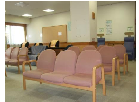
リフレッシュコーナー